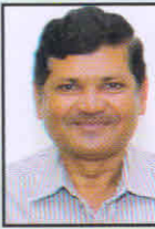
एस. आर. व ट्रेजरर