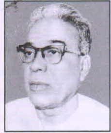
मधुकर दत्तात्रेय देवरस (बाबा साहेब)

पूना की वार्षिक 'वसन्त व्याख्यानमाला' देशव्यापी महत्व का एक ऐसा मंच है, जहाँ जीवन के विविध पक्षों पर उच्चस्तरीय चर्चा होती है। 1974 इस व्याख्यानमाला का शताब्दी वर्ष था। उस वर्ष 8 मई को वक्ता थे संघ के तृतीय सरसंघचालक बालासाहेब देवरस और उनके भाषण का विषय था 'सामाजिक समता और हिन्दू संगठन'। सामाजिक समरसता पर दिये गये प्रसिद्ध उद्बोधन के कुछ अंश यहाँ दिये जा रहे हैं-